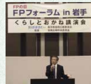
大規模講演会の模様

また、関係団体と連携して、講演会（入場料：無料）を開催しています。ホームページでお知らせしていますので、ぜひ、ご参加ください。